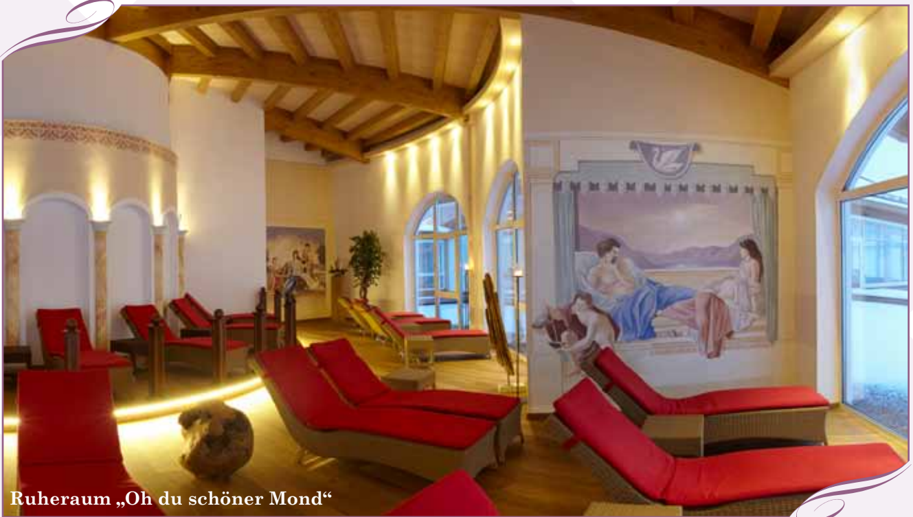
Ruheraum „Oh du schöner Mond“